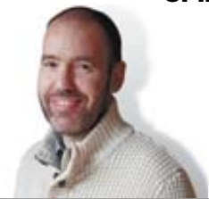
EN LÍNEA Daniel Aldaya

Seguro que por ustedes como si Carles Puigdemont se independiza por fin de casa de sus padres y luego vuelve a la masía por Navidad como el Almendro con los "tuppers" vacíos a por los insuperables calçots, la riquísima esqueixada, la butifarra casera, una miqueta de escalivada y cargols a la llauna. Estarán hartitos también de ver en la prensa el tour andorrano de las fortunas de las familias bien, como la del molt honorable Pujol y la madre abadesa. Y por eso esperaban una pregunta más amable y con más seny: ¿quiere que nuestro querido Barça gane la Liga la temporada que viene?